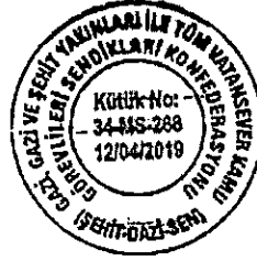
Fatih OCAK Konfederasyon Başkanı

EKLER: 1-)Divan Tespit Tutanakları( 8 Sayfa )